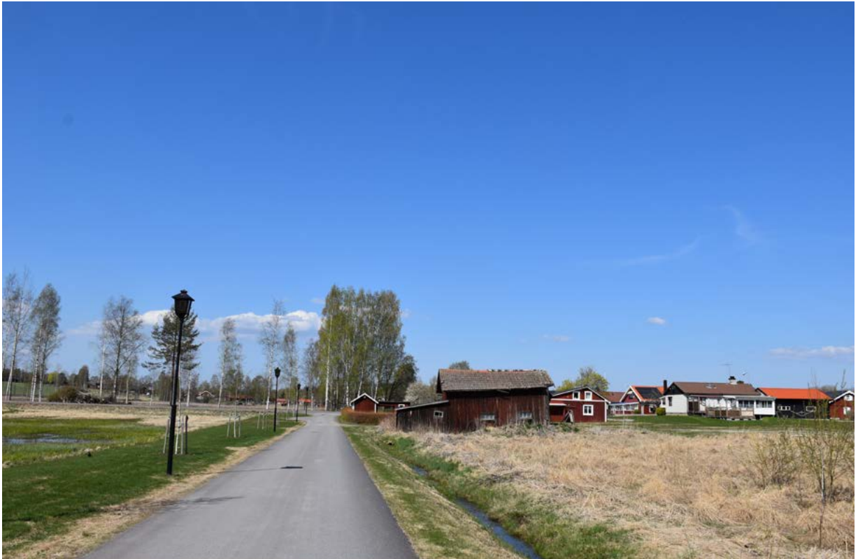
Figur 30: Ovan: Området kring griftegården. Begravningsplatsen skulle ligga på behörigt avstånd från gårdarna i Tylla, men senare har allt mer mark tagits i anspråk för bebyggelse.