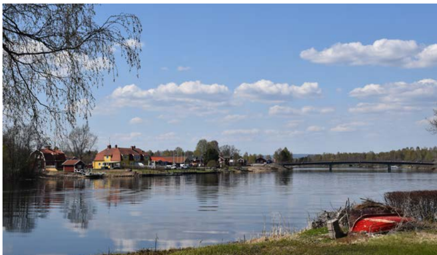
Figur 23: Ovan: Området kring bron över Dalälven sett ifrån nordost. Området är idag bebyggt med byggnader från olika tidsperioder, varav flera från 1900-talets första hälft.