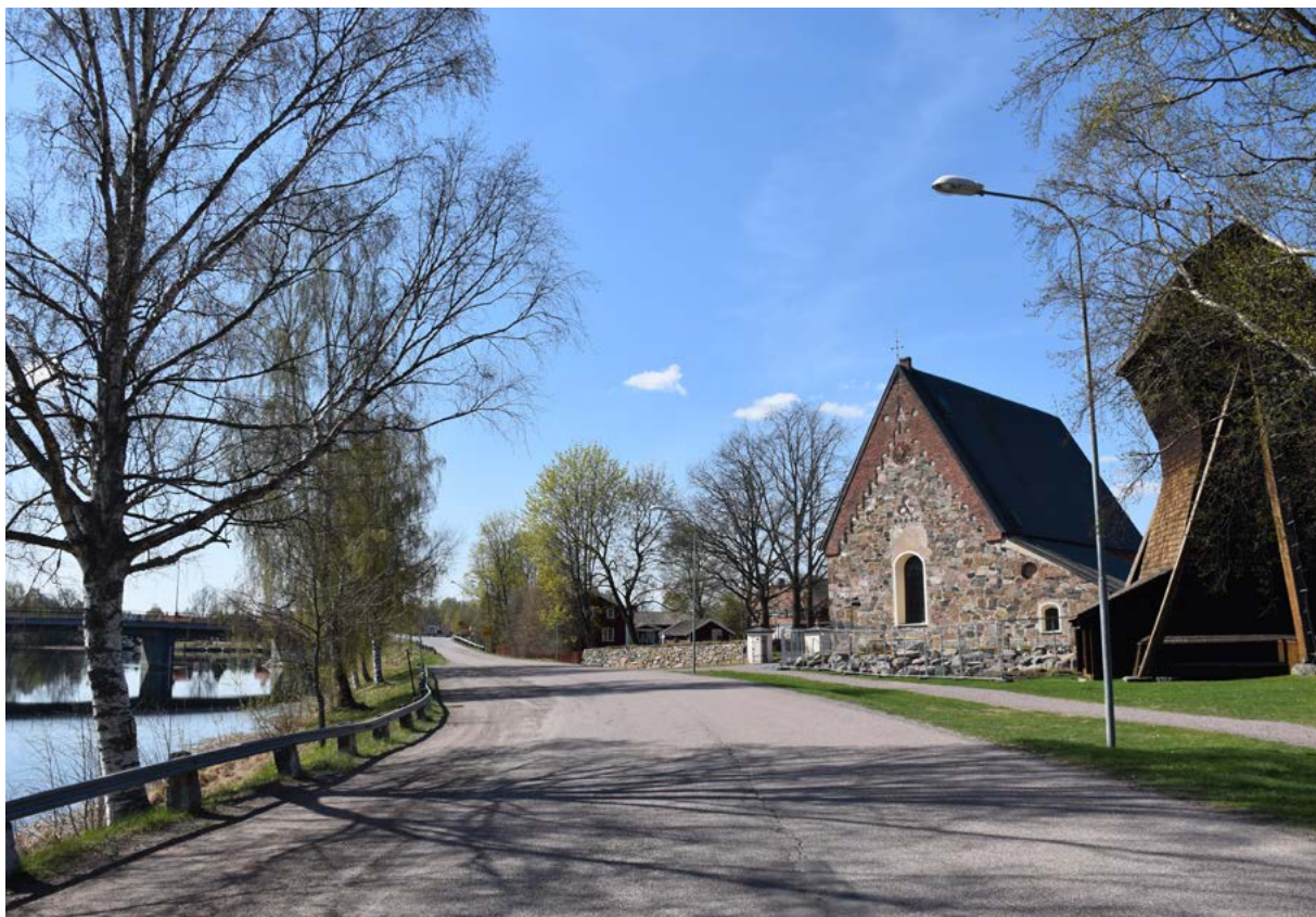
Figur 7: Ovan: Torsångs kyrka är sannolikt den äldsta kvarvarande kyrkan i Dalarna. Socknen är av mycket hög ålder, och omfattade tidigare ett betydligt större geografiskt område än idag.