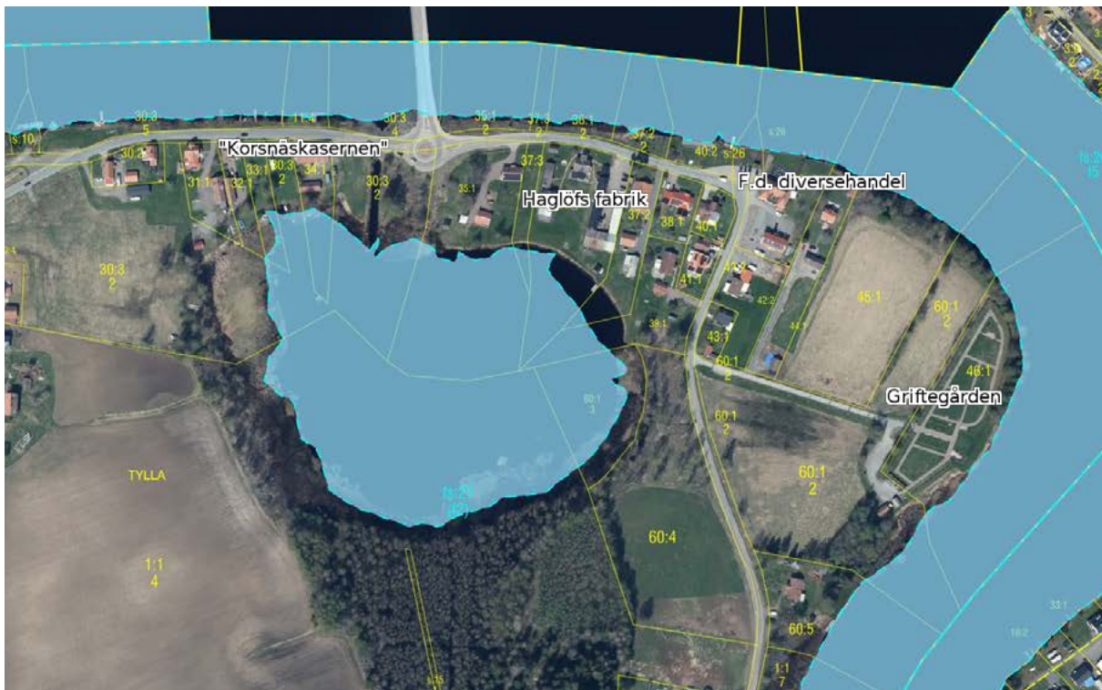
Figur 21: Området söder om Dalälven (Tylla) med markeringar för byggnader och strukturer som omnämns.