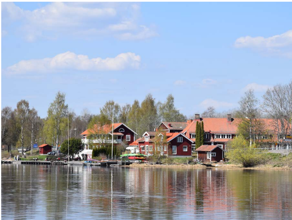
Figur 15: Bebyggelsen kring Torsångs kyrka från sydost. På bilden syns den före detta brovaktarstugan som nu är om- och tillbyggd, caféet och skolan i bakgrunden.

När Bergslaget flyttade sin största sågverksrörelse från Domnarvet till Skutskär, ökade volymerna som passerade Torsång, vilket skapade problem med logistiken i och med ständiga broöppningar. Bron, och den huvudsakliga transportvägen söderifrån, flyttades därför i början av 1890-talet till ett läge strax sydöst om kyrkan. I samband med detta byggdes brovaktarstugan (Tylla 60:6). Idag är byggnaden mycket om- och tillbyggd.