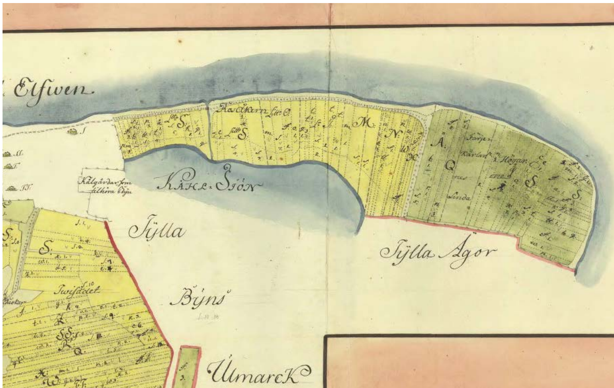
Figur 22: Karta från år 1757 över samma område. På kartan syns de mycket smala åker- och ängsskiften som tillhör Tylla bys inågor. Vid denna tid var området direkt norr och öster om Kälsjön obebyggt.