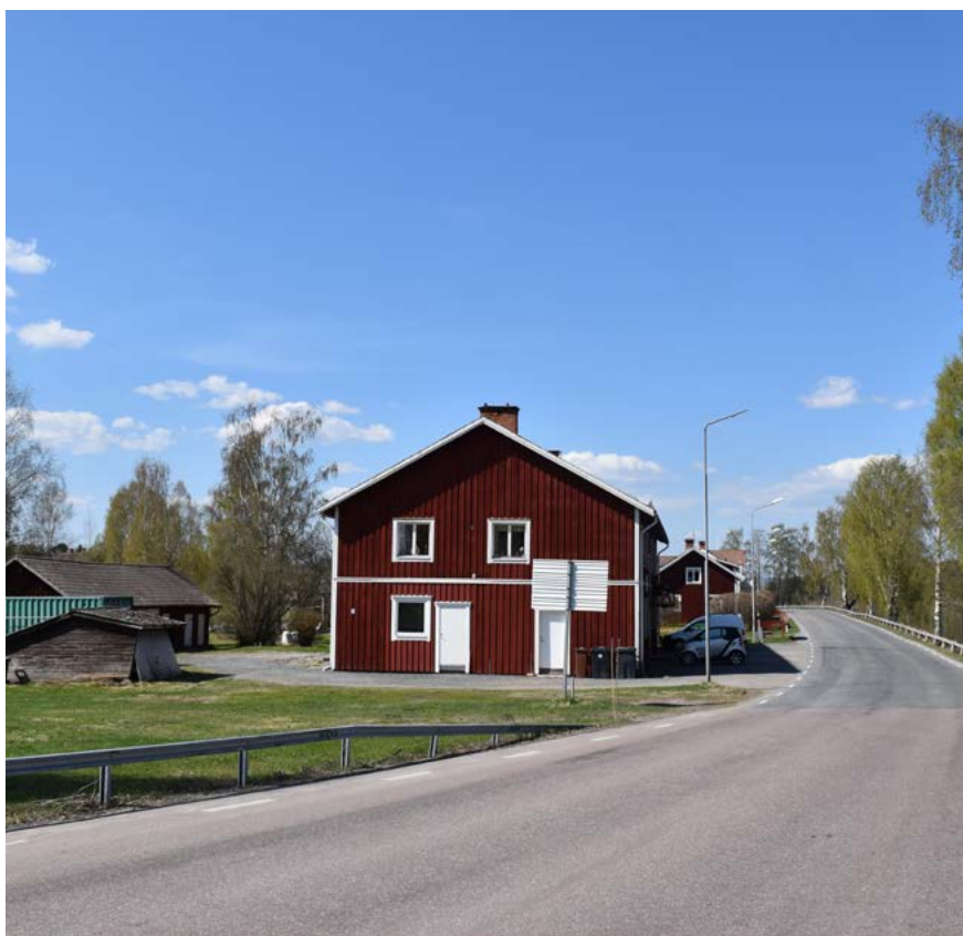
Figur 26: Till vänster: Den så kallade Korsnäs-kasernen som byggdes av Korsnäs-bolaget för arbetare inom flottningen. Byggnaden har genomgått ett flertal förändringar, men är ursprungligen uppförd under det sena 1800-talet.