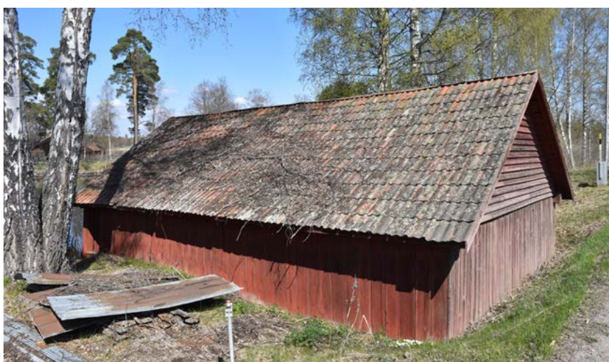
Figur 14: Till vänster: Båthus vid Lillälven, av en typ som tidigare fanns i större antal men blivit allt mer ovanlig.

Området vid inloppet till Kaplanstjärn (Tronsjö 2:10) användes som depå för flottningsföreningen i Torsång. Här ligger två byggnader i rött tegel, den större har utgjort förråd för kättingar och annat som användes i flottningsverksamheten. Den mindre byggnaden kallas Pilbo smedja, och användes för att smida olika typer av redskap till flottningen mellan 1930–60-talet. Strax norr om denna finns ett välbevarat äldre båthus med taktäckning av tvåkupiga lertegelpannor och rödfärgad panelfasad. Sannolikt har det tidigare funnits betydligt fler, liknande byggnader i området.