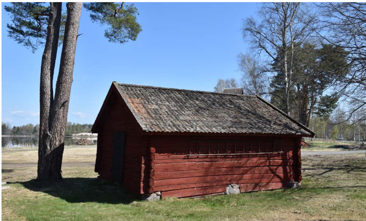
Figur 38: Ovan: Bastu från prästgården i Torsång, som flyttades till hembygdsgården år 1951.