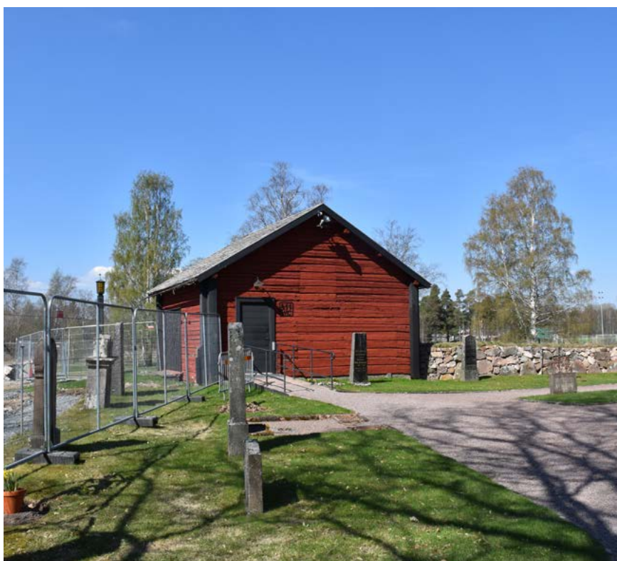
Figur 8: Till vänster: det tidigare bårhuset från år 1807 som byggdes om till gravkapell år 1952. Byggnaden är knuttimrad och ligger strax väster om kyrkan.