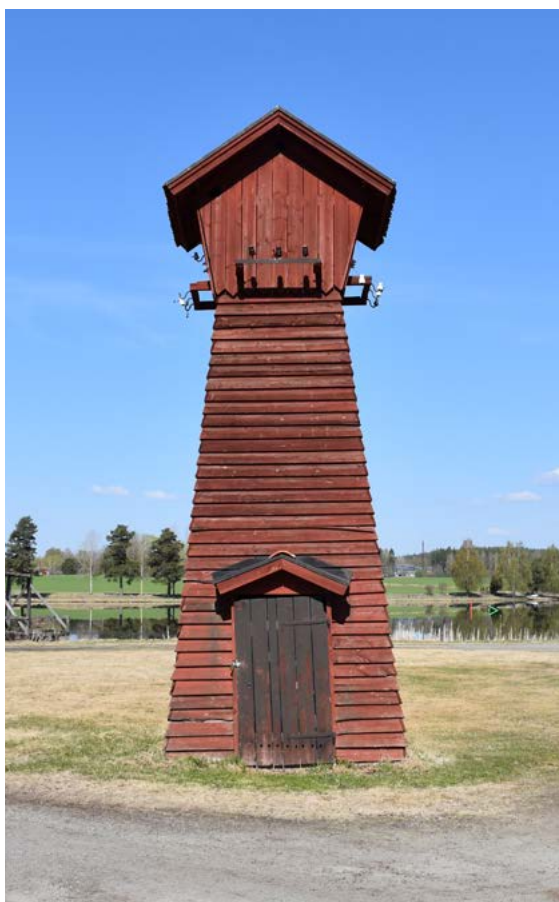
Figur 40: Till vänster: Transformatorstation av typen "Falu-jungfru" eller "dalkulla" utgör en av de mer sentida byggnaderna på hembygdsgården i Torsång.