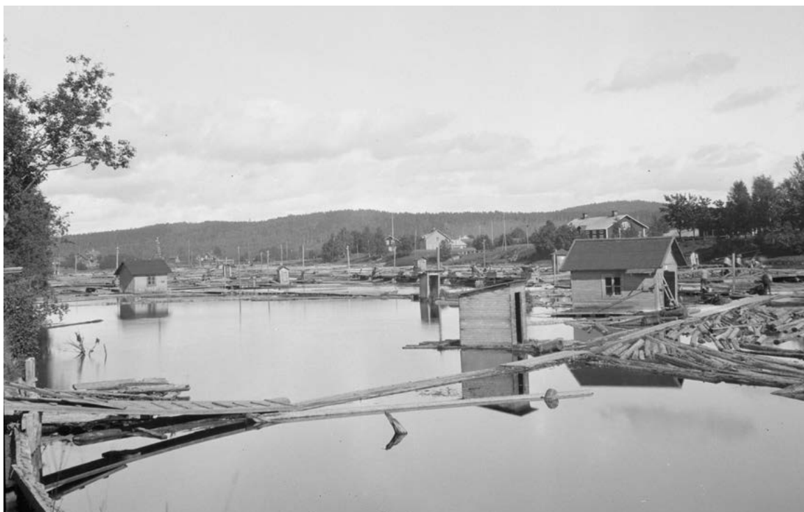
Figur 5: Dokumentation av timmerskiljet i Torsång från 1920-talet. Flottningen var en mycket viktig verksamhet, som sysselsatte många kring Dalälven.

Området kring socknens centrum har historiskt påverkats av verksamheten vid Stora Kopparberget. Mellan Dalälven och Runn gick kopparskutor, som transporterade råkoppar mellan Strand i Vika och Enbacka i Gustafs socken. Skogarna högs i mycket stor utsträckning ner, och timmerflottningen kom igång under gruvans storhetstid på 1600-talet för att förse gruvan med timmer. Flottningen var dock mest betydelsefull under delar av 1800-talet, då Torsång utgjorde del av Sveriges största sågverksdistrikt, med sågarna i Ornäs, Nyckelby, Tronsjö, Tisken, Vika och Korsnäs. I slutet av 1800-talet flyttade sågverken till kusten, då det blev möjligt att flotta timmer hela vägen. Torsångs skiljebom fortsatte dock ända in på 1900-talet att vara en viktig plats för sortering av virket från flera skogs- och sågverksbolag.