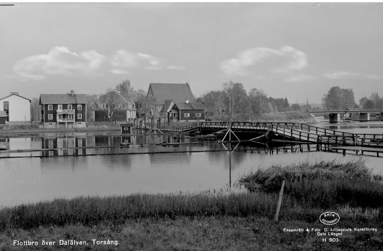
Flottbro över Dalälven, Torsång