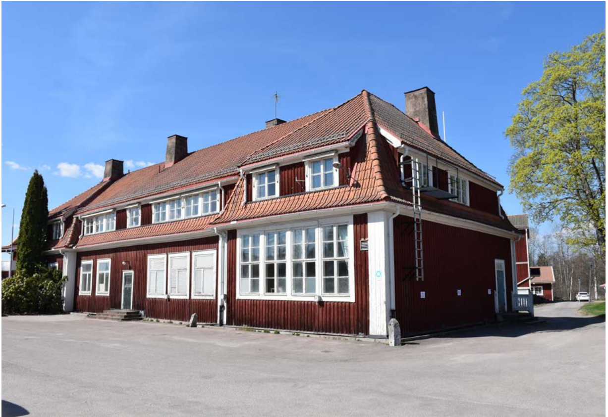
Figur 10: Ovan: Den före detta folkskolan i Torsång har en tydlig bevarad karaktär från tiden för uppförandet. Byggnaden står i nuläget utan användning.