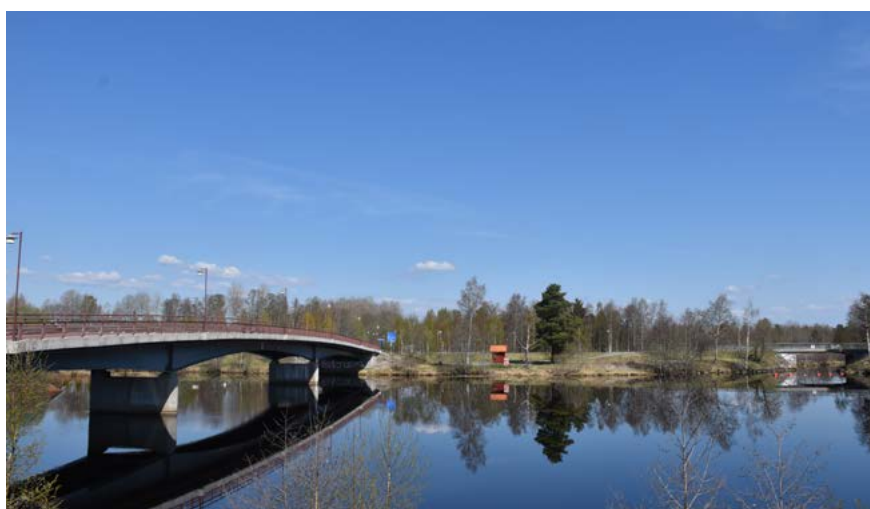
Figur 4: Till vänster: broarna över vattendragen utgör idag ett tydligt inslag i landskapsbilden, men är egentligen relativt sent tillkomna. Bron över Dalälven närmast i bild byggdes år 1971 som ersättning för en tidigare flottbro.

Passagen mellan Prästtjärn och Runn var ursprungligen inte öppen [fig. 3], utan grävdes ut för att främja timmerflottningen på 1800-talet. Kyrkan och bebyggelsen med direkt anknnytning till denna ligger på ett smalt näs mellan Dalälven och Lillälven, en plats med mycket lång historisk kontinuitet. Vattenvägarna är en central aspekt av kyrkans placering, liksom tillgången till bördig jord kring älvens delta. Landskapet kring vattendragen utgörs av hävdad odlings- och betesmark med varierande topografi. Norr och väster om