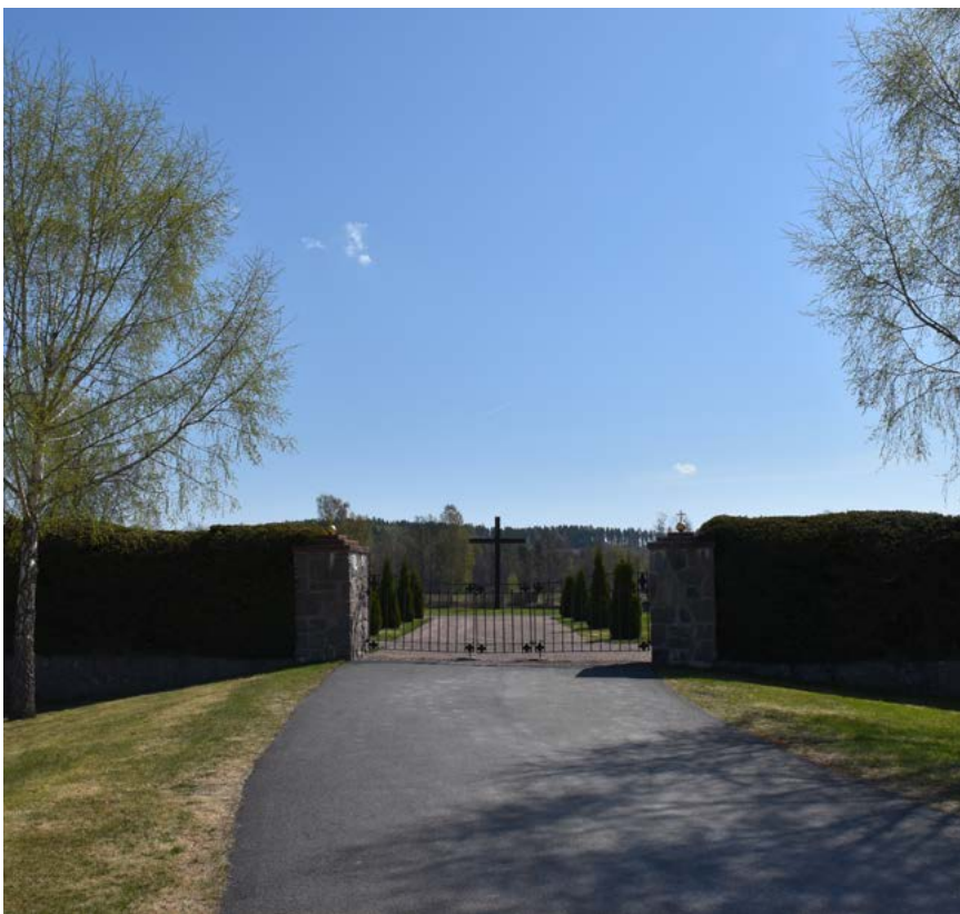
Figur 31: Till vänster: Begravningsplatsen omgärdas av höga häckar, och nås via en smidesgrind mellan stora naturstensstolpar. Genom begravningsplatsen går en grusväg, med ett stort kors som centralmotiv.