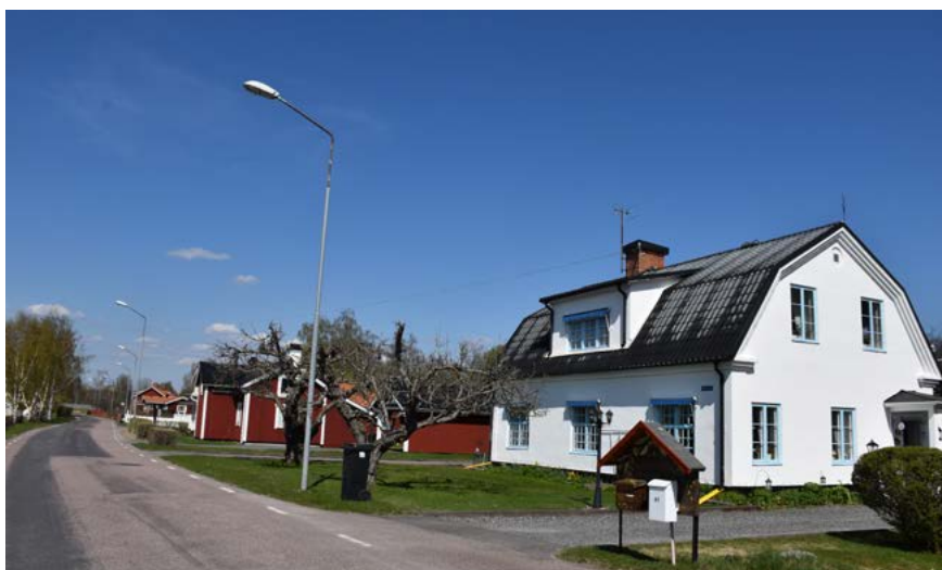
Figur 34: Till vänster: Byggnaden närmast i bild har varit mejeri och använts av ett företag inom skinnindustrin. Nu är den privatbostad.

Dalarnas Mejeriförening bildades år 1933 med stora anläggningar dit mjölken kördes från byarna. Den hyrdes sedan ut till olika verksamheter, bland annat företaget H. Halvarssons Skinn AB, innan den blev privatbostad. Byggnaden har putsad fasad som är avfärgad i vitt. Längs takfoten finns ett profilerat listverk. Fönstren är äldre och sidohängda, mot gatan är rutorna småspröjsade, medan gavelns fönster är indelade i tre rutor per fönsterbåge. På tomten finns även en uthuslänga med sadeltak och rödfärgad panelfasad.