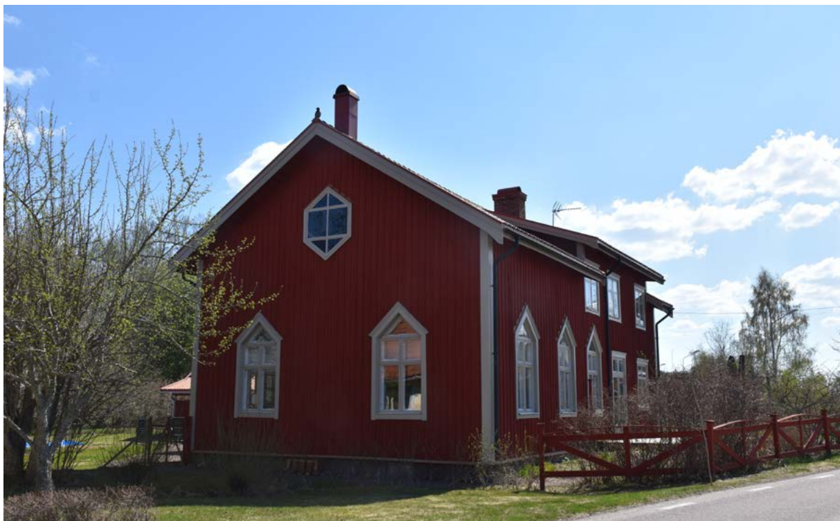
Figur 33: Ovan: Det före detta Elimkuppet, nu mera privatbostad. De höga spetsbågiga fönstren möjliggör förståelse för byggnadens tidigare funktion.