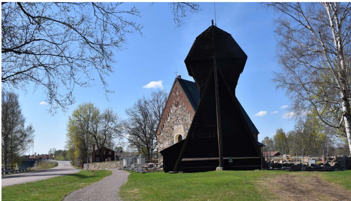
Figur 36: Ovan: Den spånklädda klockstapeln vid Torsängs kyrka och vägsträckningen längs älven utgör en vy som förändrats genom tiden, men med beståndsdelar av mycket hög ålder.