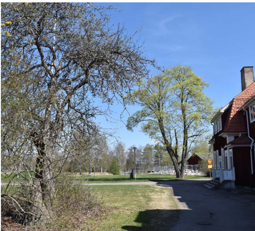
Figur 11: nedan: Träd och buskar från den tidigare skolgården finns ännu kvar.