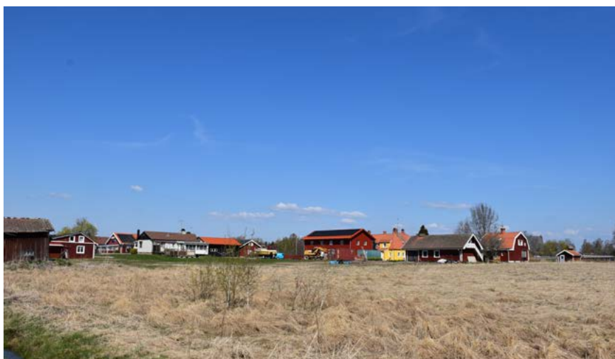
Figur 24: Nedan: Vy över området från sydost. Det finns fortfarande kvar delar av det tidigare öppna landskapet, om än att en gradvis avstyckning av tomter skett under 1900-talet.