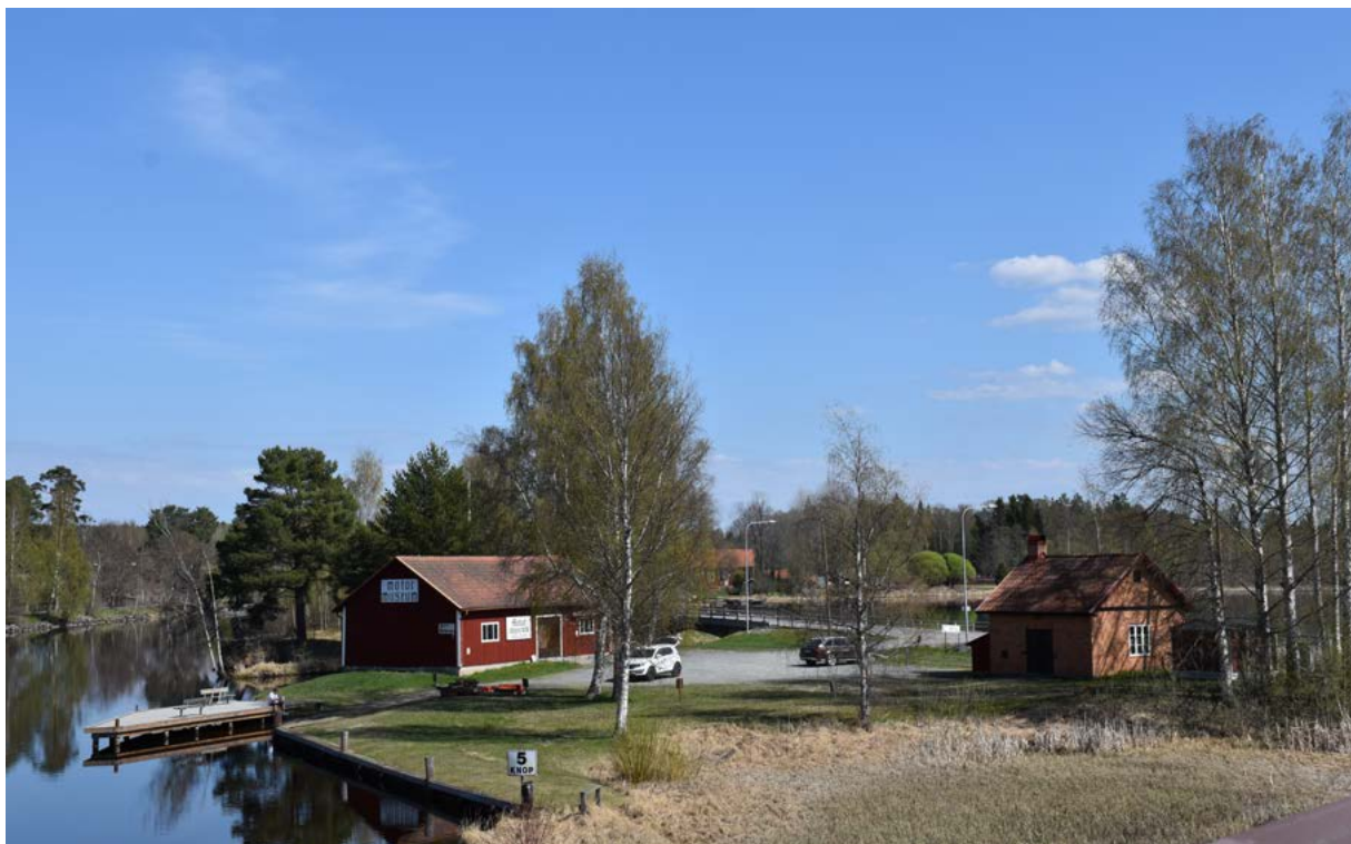
Figur 13: Ovan: Flottningsföreningens depå med förråd och den så kallade Pilbo smedja till höger. I smedjan smiddes redskap som behövdes till flottningen. Idag används byggnaderna av hembygdsföreningen och Torsångs Motormuseum.