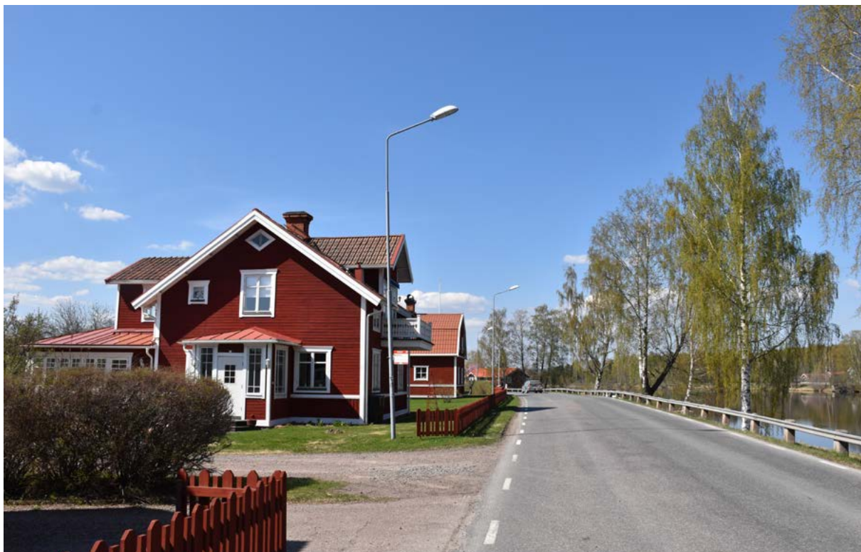
Figur 25: Ovan: vägsträckningen längs älven har historisk kontinuitet till åtminstone 1700-talet. Till vänster i bild syns ett korsplanshus från det tidiga 1900-talet, en byggnadstyp som är vanligt förekommande i hela nuvarande Borlänge kommun.