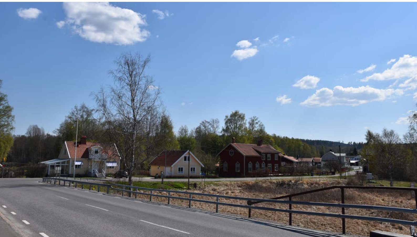
Figur 32: Bebyggelsen i Räfstylla sedd ifrån Lillälvsbron. Bebyggelsen ligger på små tomter på rad längs den södergående vägen. Området är sannolikt relativt sent ianspråktaget, de äldsta byggnaderna är uppförda under tidigt 1900-tal.