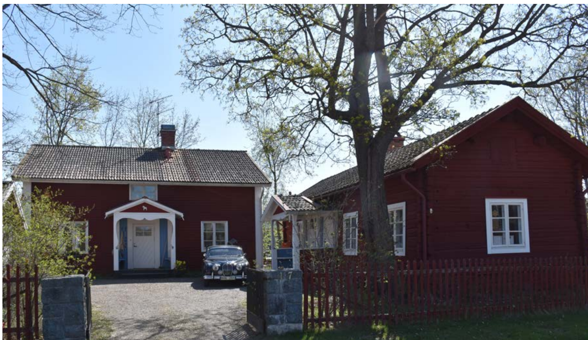
Figur 9: Kaplans-/klockargården ligger direkt sydost om kyrkan. Den utgörs av två äldre timrade bostadshus i vinkel kring ett öppet gårdstun. Runt tomten finns ett rödfärgat spjälstaket och höga lövträd. Byggnaderna genomgick omfattande renoveringar kring 1900-talets mitt.

Söder om kyrkan ligger en före detta folkskola, som uppfördes år 1919 enligt ritningar av arkitekt Edward Dahlbäck i Bro. Det har dock under lång tid funnits skola i anslutning till kyrkan, då utbildning länge varit en angelägenhet för socknen. I anslutning till skolan finns rester av en trädgård, med äldre fruktträd och annan växtlighet. Skolhuset består av flera sammanbyggda byggnadsvolymer, med två gavelställda flyglar i norr respektive söder och en rektangulär volym som mittparti [fig. 10]. Takformerna utgörs av valmade mansardtak med lätt utsvängda avslut nedåt mot takfoten. Fasad utgörs av rödfärgad locklistpanel, med markerade vita knutar, fönster- och dörrfoder. Fönstren har varierande storlek och indelning, där lektionssalarnas fönster är höga med stående proportioner och öppningsbara övre rutor. Ovanför entrédörrarna finns mindre överljusfönster. Fönstren är generellt sidohängda med fasta spröjsar. Skolgården är mestadels asfalterad, men med en viss del upp vuxen växtlighet. År 1977 flyttades tre manskapsbodas som tidigare tillhört stadsingenjörskontoret i Borlänge till fastigheten, för att användas som bland annat slöjdlokaler. De byggdes om med lärarrum, lektionssalar och församlingsal efter ritningar av Berndt Staffas arkitekt och byggkonsult AB år 1980.