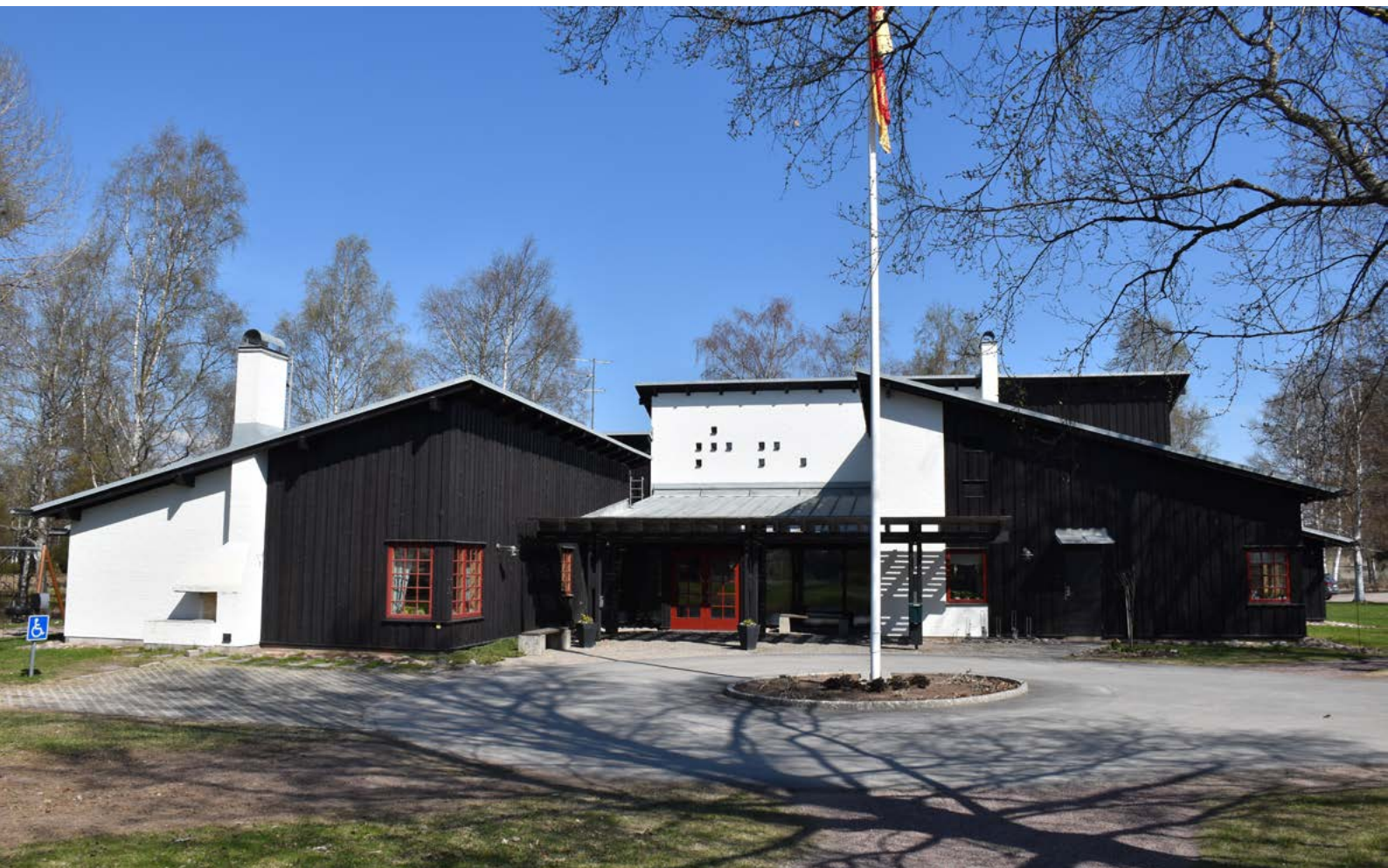
Figur 12: Församlingshemmet i Torsång uppfördes under det tidiga 1980-talet. Byggnaden har ett eget uttryck, med förskjutna volymer med pulpettak och variation i fasadmaterialet.

Norr om kyrkan, på fastigheten Torsånga prästgård 1:22, ligger Torsånga församlingshem [fig.12]. Byggnaden är uppförd år 1981 enligt ritningar från Mats Stenqvists arkitektkontor. Den har en utformning med förskjutna byggnadsvolymer med pulpettak och asymmetrisk fasadkomposition. Fasaderna utgörs av en blandning mellan mörk, tjärad locklistpanel och ljus avfärgat slammat tegel. Några av fönstren är spröjsade med fasta småspröjsar.