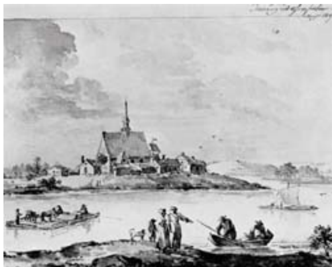
Denna bild är en känd lavering 1807 av G Silfverstråhle som visar överfarten vid Torsång. -Konstakademien