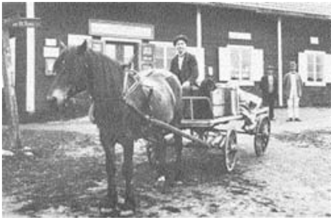
Bild 4. C.J. Lindströms Diversehandel.