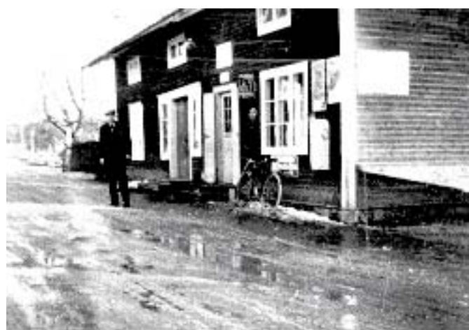
Bild 10. Torsångs kafé före ombyggnaden 1935.