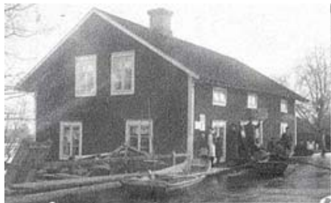
Bild 9. "Ro hit med en kopp kaffe!" Torsångs kafé vid den stora vårfloden 1916.

Walfrid drev kaféet i sjutton år till 1921, då han flyttade till Värmland.