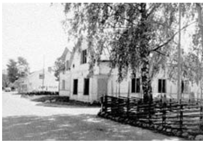
Bild 2. 1914 byggde Wikzell en ny fastighet vid Tyllavägen och blev granne med Lindströms Diversehandel, som syns i bakgrunden.