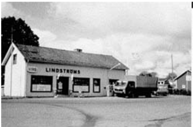
Bild 5. Lindströms på 1970-talet, efter den senaste ombyggnaden.